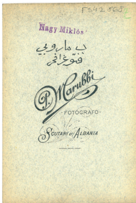
8. kép (hátlappal)

Pietro Marubbi: Albán férfi hagyományos viseletben, fegyverrel , Scutari (Skodra), Bulgária, 1870-es évek (?), 10 × 14 cm albumin pozitív; 11 × 16 cm-es műtermi rektóval és versóval ellátott kabinetkép. Néprajzi Múzeum, F 342868